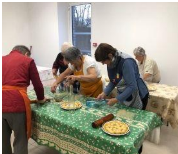
Confection d'oreillettes le 22 novembre 2024